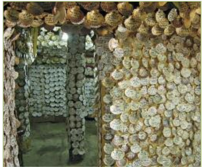
Le bar « El Rincon de Peregrino » à Albergueria