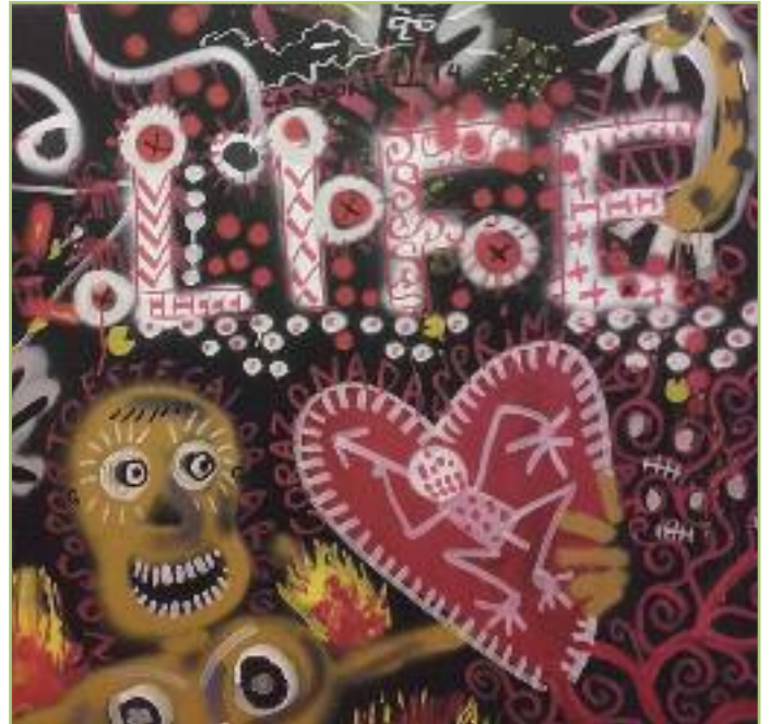
Photo prise par un jeune Seuil sur le chemin

Pour sa part, Seuil contribue bien sûr à la mise en œuvre de ces mesures alternatives pour l'insertion des jeunes mineurs.