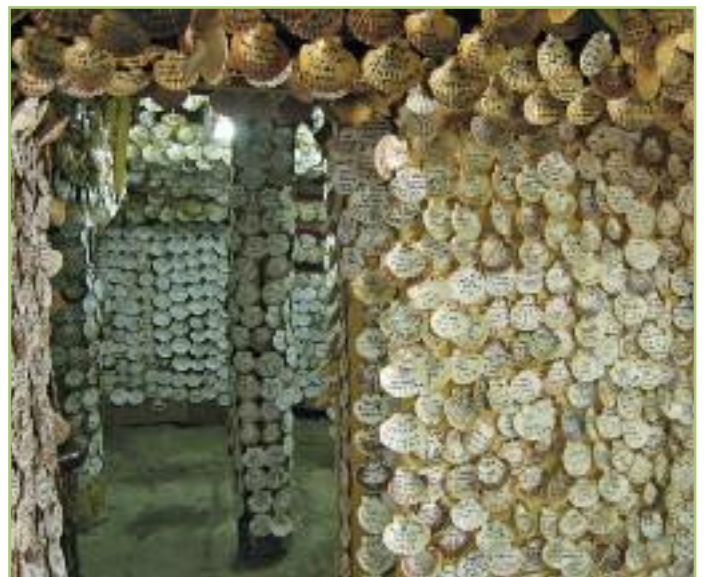
Le bar « El Rincon de Peregrino » à Albergueria