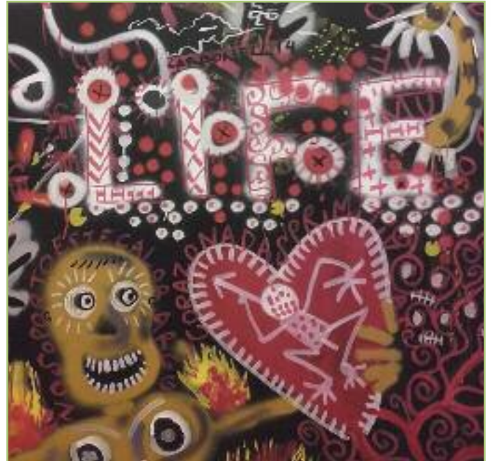
Photo prise par un jeune Seuil sur le chemin

Pour sa part, Seuil contribue bien sûr à la mise en œuvre de ces mesures alternatives pour l'insertion des jeunes mineurs.