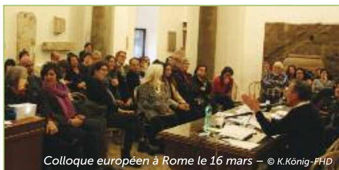
Colloque européen à Rome le 16 mars

> Lire l'article : http://www.lastampa.it/2017/03/27/societa/la-sfida-dei-ragazzi-a-rischio-in-cammino-per-riscattarsi-2z7fPS7ca2LLHPfUHo237O/premium.html