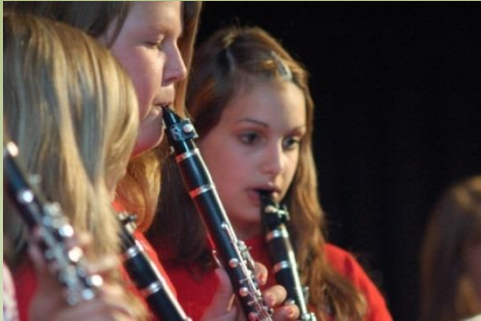
Bläserklassen in Jg. 5-8